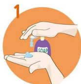
Uporabite dovolj mila