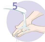
Roke temeljito sperite.