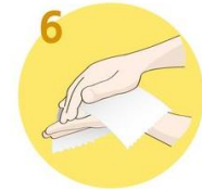
Roke temeljito obrišite s papirnato brisačo