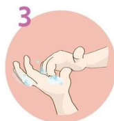
Konice prstov namilite s krožnimi gibi