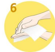
Roke temeljito obrišite s papirnato brisačo