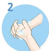
Drgnite dlan ob dlan