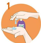
Uporabite dovolj mila