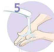
Roke temeljito sperite.