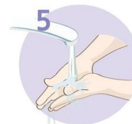
Roke temeljito sperite.