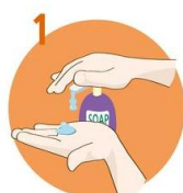
Uporabite dovolj mila