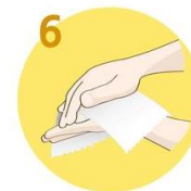
Roke temeljito obrišite s papirnato brisačo