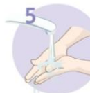
Roke temeljito sperite.