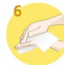
Roke temeljito obrišite s papirnato brisačo