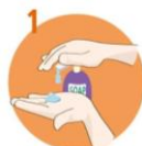
Uporabite dovolj mila