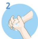
Drgnite dlan ob dlan