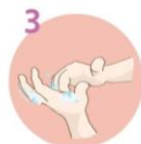
Konice prstov namilite s krožnimi gibi