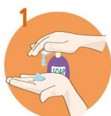
Uporabite dovolj mila