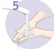
Roke temeljito sperite.