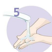
5 Roke temeljito sperite.