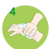
4 Zdrgnite dlani