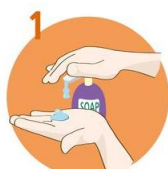
1 Uporabite dovolj mila