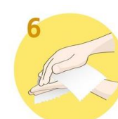
6 Roke temeljito obrišite s papirnato brisačo