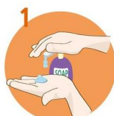
Uporabite dovolj mila