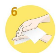
Roke temeljito obrišite s papirnato brisačo