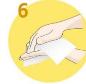
Roke temeljito obrišite s papirnato brisačo