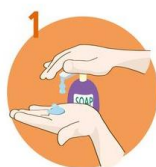
Uporabite dovolj mila