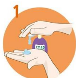
Uporabite dovolj mila