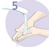
Roke temeljito sperite.