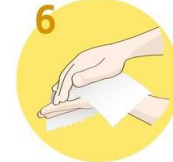
Roke temeljito obrišite s papirnato brisačo