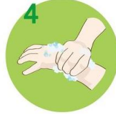
4 Zdrgnite dlani