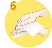
6 Roke temeljito obrišite s papirnato brisačo