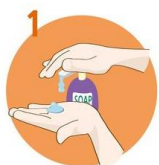
1 Uporabite dovolj mila