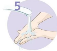
5 Roke temeljito sperite.