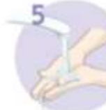
5 Roke temeljito sperite.