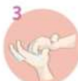
3 Kralice prstov namočite v kraljico gibe