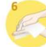
6 Roke temeljito obrišite s papirnato brisačo