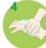
4 Strgajte dlani