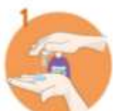
1 Uporabite dovolj mila