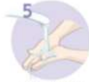
5 Roka temeljito sperite.