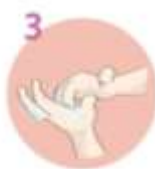
3 Konic prstov masirajte s krogičnimi gibi