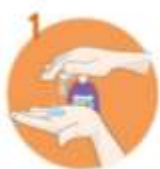
1 Spriznite dlanov mlko