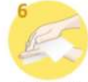
6 Roka temeljito obrišite s posušenimi brisačo