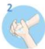
2 Drgnite dlan ob dlan