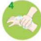
4 Zdrgnite dlani